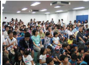
▲筑波宇宙センターでのライブ映像中継状況