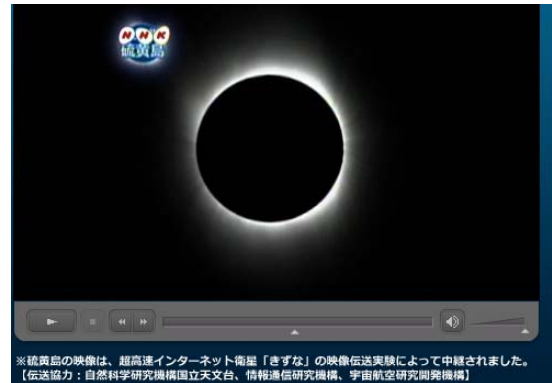
▲皆既日食

7月22日には日本では46年ぶりとなる皆既日食の映像と木漏れ日観察映像の伝送が「きずな」を使って行われました。映像伝送は、国立天文台(NAOJ)をはじめ、情報通信研究機構(NICT)、JAXAと共同で行われ、硫黄島、父島での日食の状況がインターネット経由で配信されました。NOAJ、NHKが撮影した日食映像はTV放送に使われたほか、各地の科学館やJAXA施設でもライブ上映が行われました。