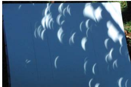
▲ 観察された木漏れ日