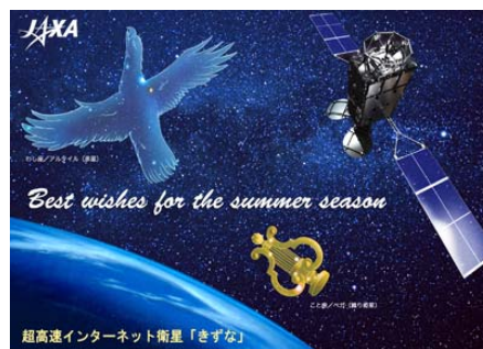
▲七夕にちなんだメール添付のイラストカード