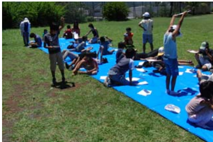
▲小笠原小学校での木漏れ日観察