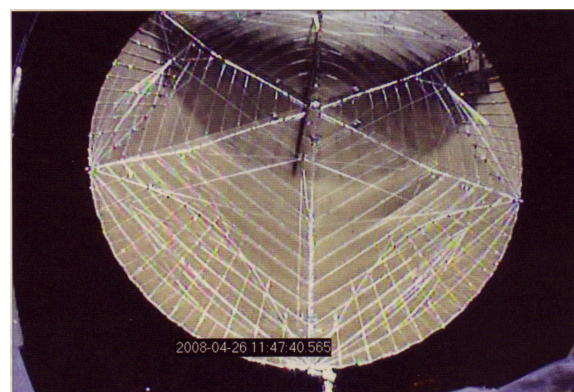
搭載カメラが動画撮影した ICO G1 の 12m アンテナ反射器

5 月に、Orbcomm はその次世代の衛星群のためにシエラ・ネバダ・マイクロサット (Sierra Nevada Microsat) と契約した。サレー・サテライト・テクノロジー (Surrey Satellite Technology) は、14 個の小型衛星の注文残を抱え健全であり、航行と通信のための小型 LEO 衛星の市場が続くことを示している。