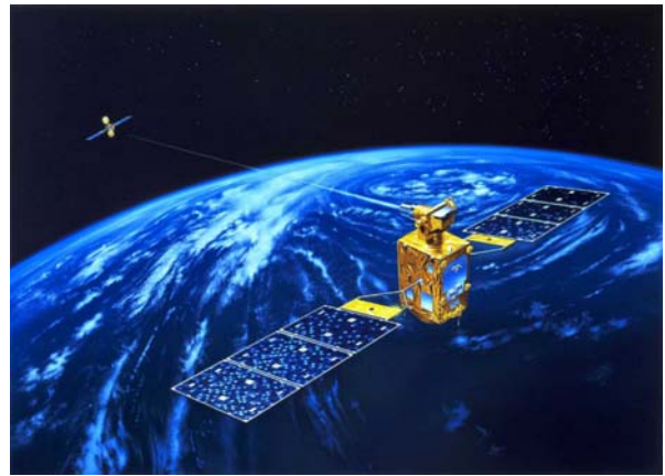
光衛星間通信実験

JAXA は国の役割として期待されている国民の安全、安心を確保するために必要な種々の観測や、通信を行う衛星、宇宙における通信インフラとして必要になる衛星間のデータ中継を行う衛星等の開発を通して、世界から遅れている衛星開発を世界に比肩できる衛星技術として確立していきたいと思います。このために必要な先進的技術の研究、信頼性向上に必要な研究を牽引して行ければと思います。したがって企業も自主技術開発の努力を行うとともに、早期に世界の衛星事業に参加できるような戦略を立て、推進してもらいたいと思います。利用ニーズにこたえる、より高度な、先進的ミッションを実現するとともに、これまでの衛星開発で培った信頼性の高い、長寿命の衛星を開発することによりコスト、性能、スケジュール面でワールドクラスとなることを JAXA と企業がそれぞれの役割を担いつつ、実現して行ければと思います。