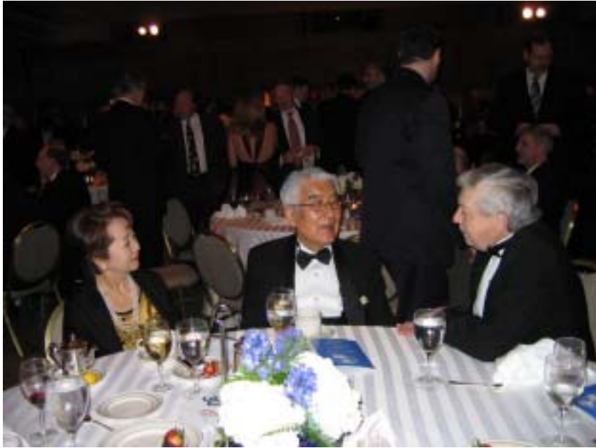
Fig 7 SSPI Gala- 2