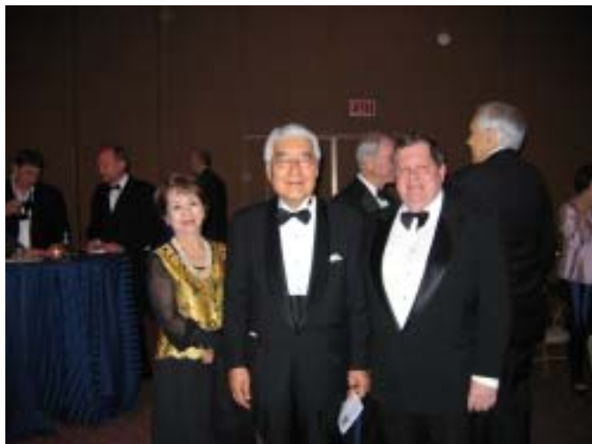
Fig. 5 表彰式会場風景