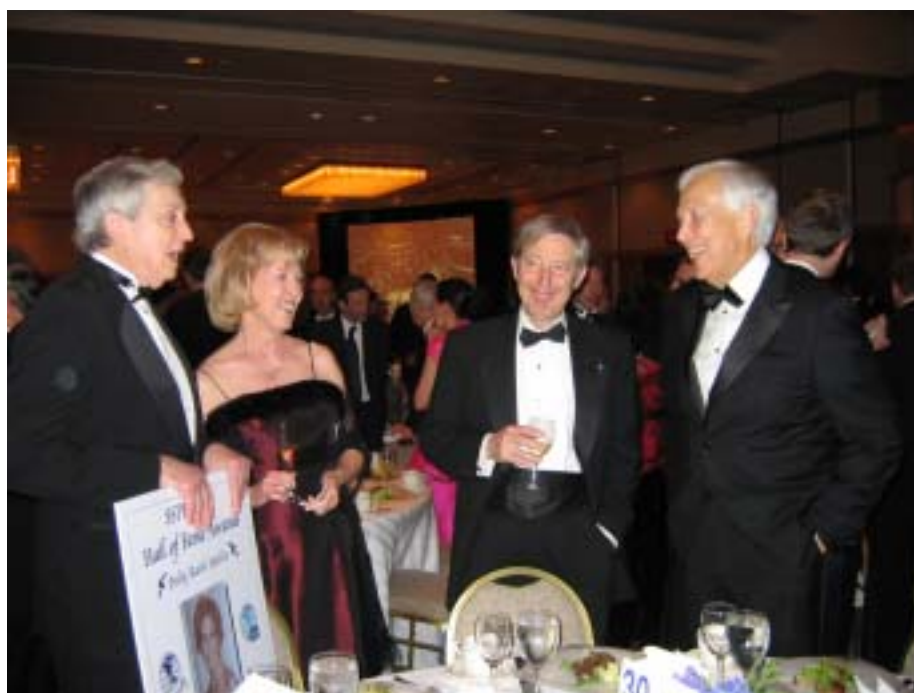
Fig 6 SSPI Gala- 1