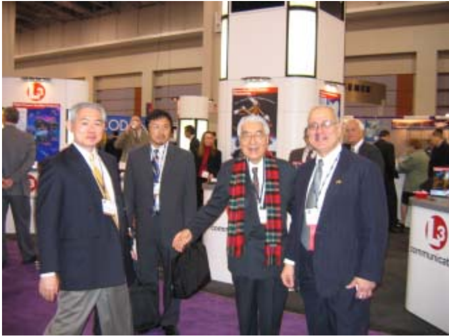
Fig 9 展示会場にて：その 2