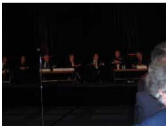
Fig 2 官民協力を討議するパネル(右より2人目、軍代表)