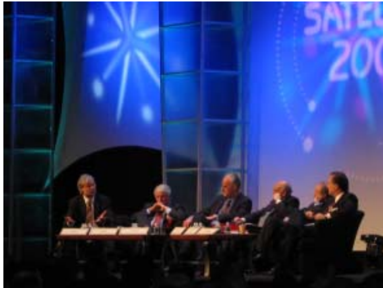
Fig. 1 パネル討論風景