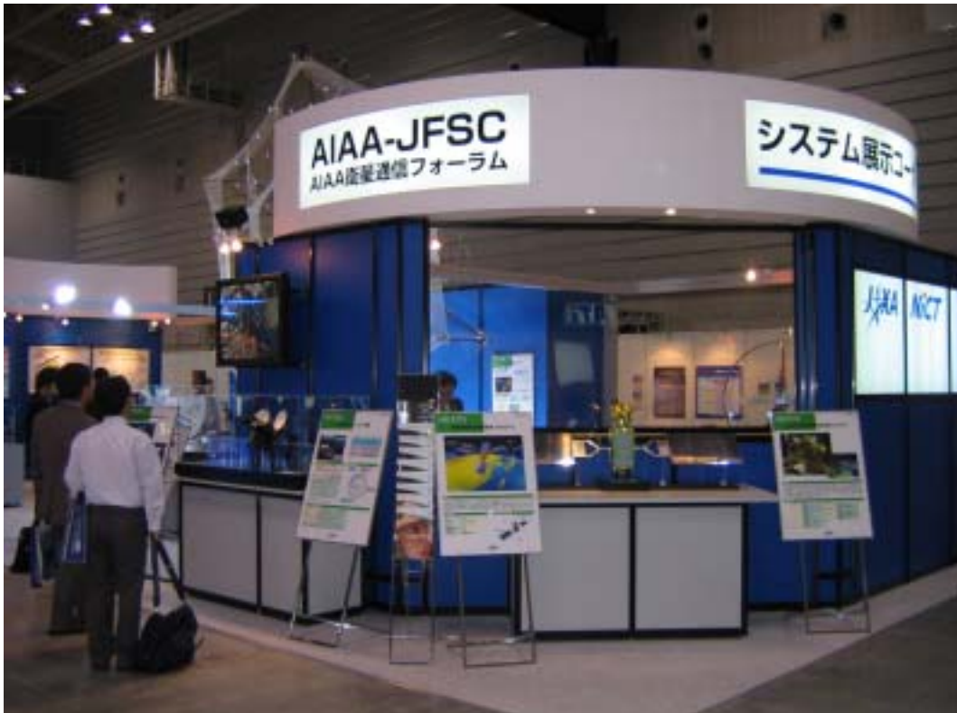
展示風景：右側(OIS ETSやWINDSの模型が見える)