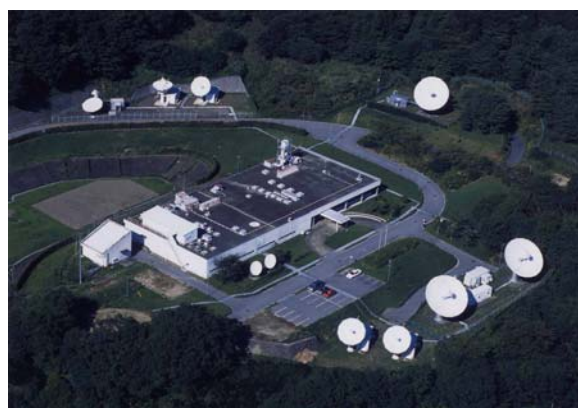
君津衛星管制所 (副局 無人)