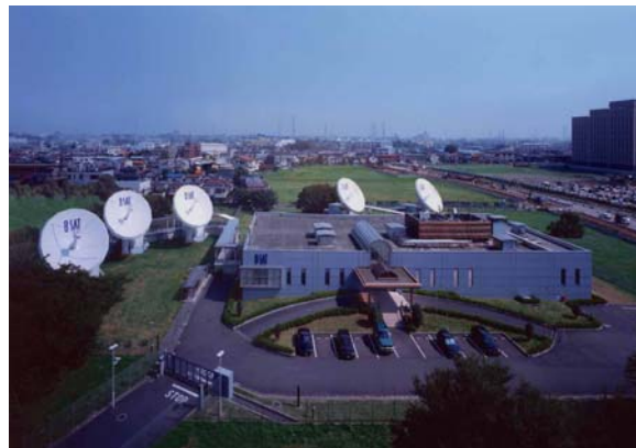
川口衛星管制センター (主局)

1998年10月の通信・放送機構 (TAO) 君津管制センターの無人化に伴い、NHK、WOWOW から、BS-3N の管制業務を受託し、翌 11 月から川口衛星管制センターから遠隔制御で管制業務を実施しています。