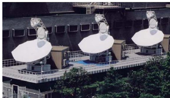
アップリンクセンター (渋谷)