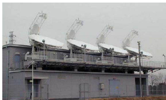
アップリンク副局 (菖蒲)