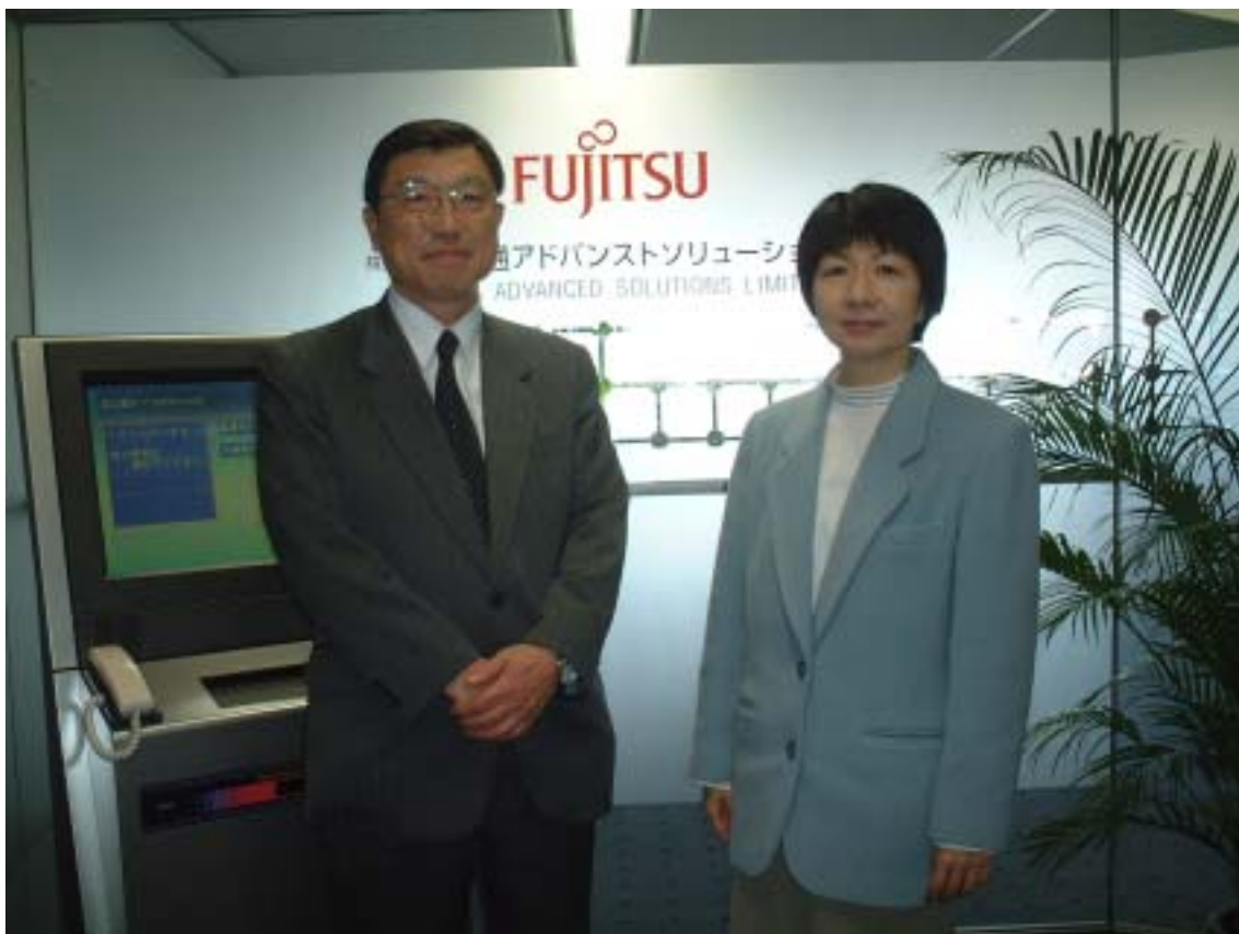
富士通アドバンスソリューションズ 広西社長と

仕事の本当の面白さは、やっているうちにわかってくるものだというのが私の持論です。したがって、今までやってきた仕事は、1つ1つそれなりに面白かったと思っています。その中で1つ例を挙げると、通信衛星に関するものとしてはO I C E S Tのミッション解析があります。これは、O I C E T Sの光通信実験に関するミッション成立性確認を目的とした解析でした。なにしろ、光通信実験を実施するための条件がいろいろある・・・太陽/月干渉があってはならない、キャリアレーション時は特定の恒星が見えなければならない、L U C Eの駆動制限、衛星の電力制限、実験データをダウンリンクする上での回線制約など、いろいろな必須要件と阻害要件を整理して、いつ、どれくらいの回数の実験が可能なのかを調べるというものでした。この解析は、それまで私がやっていた追跡サイドの運用解析とはちょっと趣が異なり、いろいろな情報を整理して、まずどんな解析をすれば良いのかということから検討を行い、問題解決型の解析としては大変面白い仕事でした。また、解析という仕事の付加価値を考えるキッカケともなり、意義深いものがあったと思います。