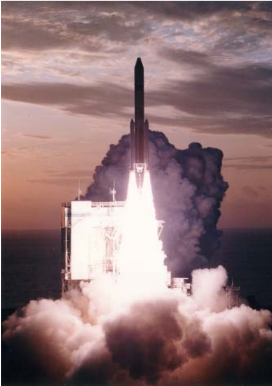
H - ロケット1号機打ち上げ (ETS - は2号機で打ち上げられた)