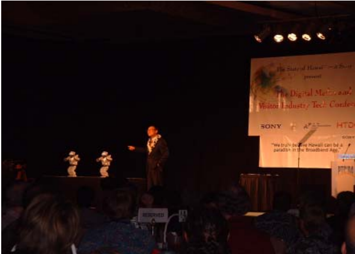
Fig 1 Luncheon Session by Sony Corporation

ている Session が目立った、特に Sony sponsor の昼食会ではソニーの開発したロボットによるアトラクションが行われ、人気を呼んでいたことが印象的であった。PTC も通信より Digital 総合家電の時代に入った感がある。