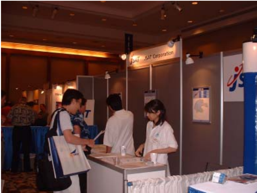
Fig 3 展示風景 1 JSAT 株式会社