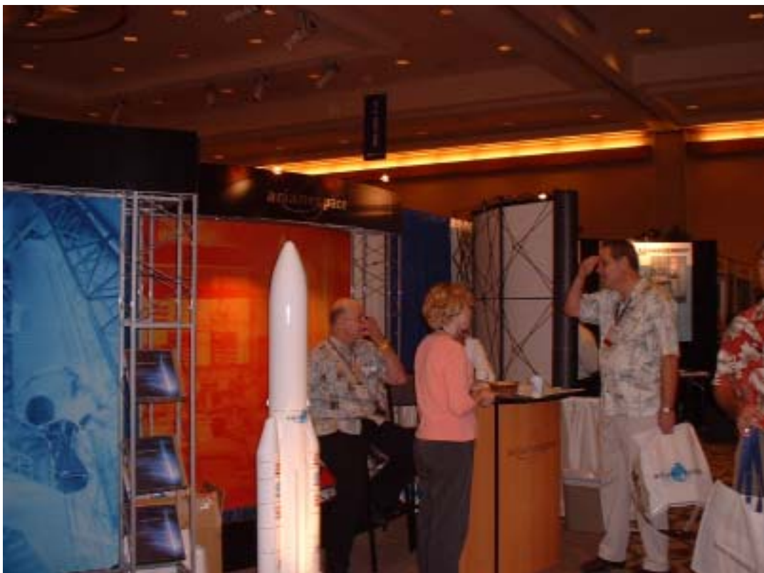
Fig 4 展示風景 2 Ariane Space