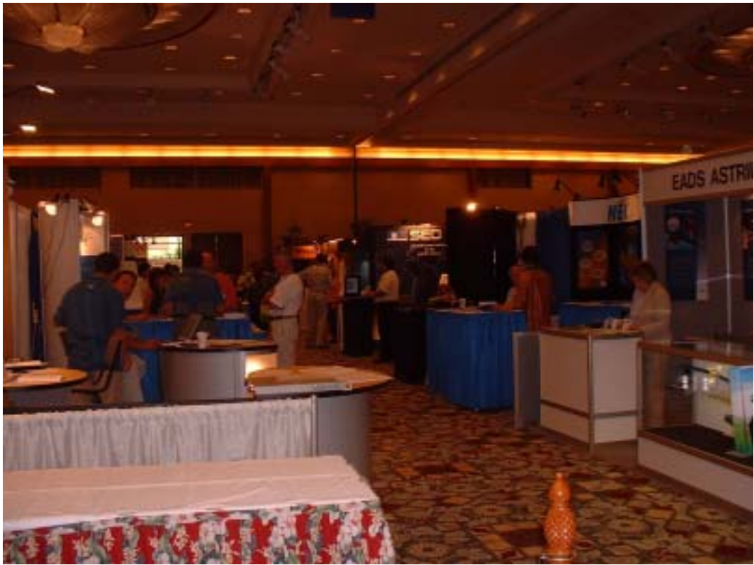
Fig- 5 展示風景 3