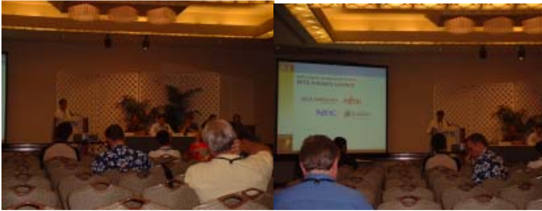
Fig 2 Conference 会場 An Analysis of the Satellite Industry's New Reality